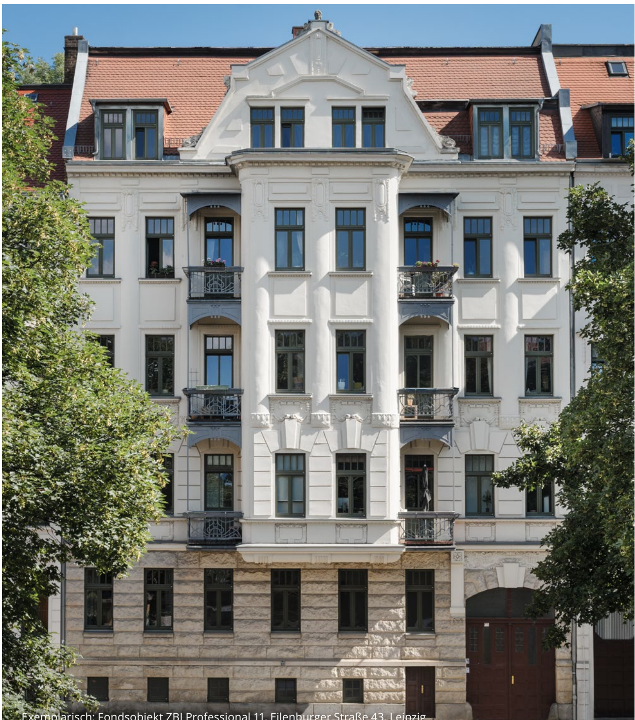
Exemplarisch: Fondsobjekt ZBI Professional 11, Eilenburger Straße 43, Leipzig

ZBI ZENTRAL BODEN IMMOBILIEN GMBH & CO. ZWÖLFTE PROFESSIONAL IMMOBILIEN HOLDING GESCHLOSSENE INVESTMENTKOMMANDITGESELLSCHAFT